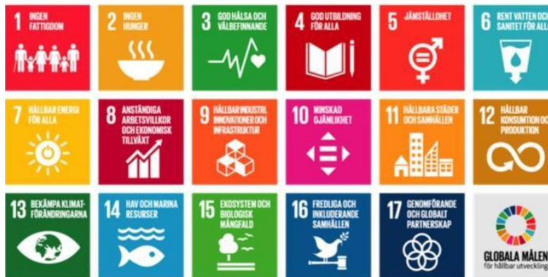
Figur 1. De globala målen

Vid FN:s toppmöte den 25 september 2015 antog världens stats- och regeringschefer 17 globala mål och Agenda 2030 för hållbar utveckling.