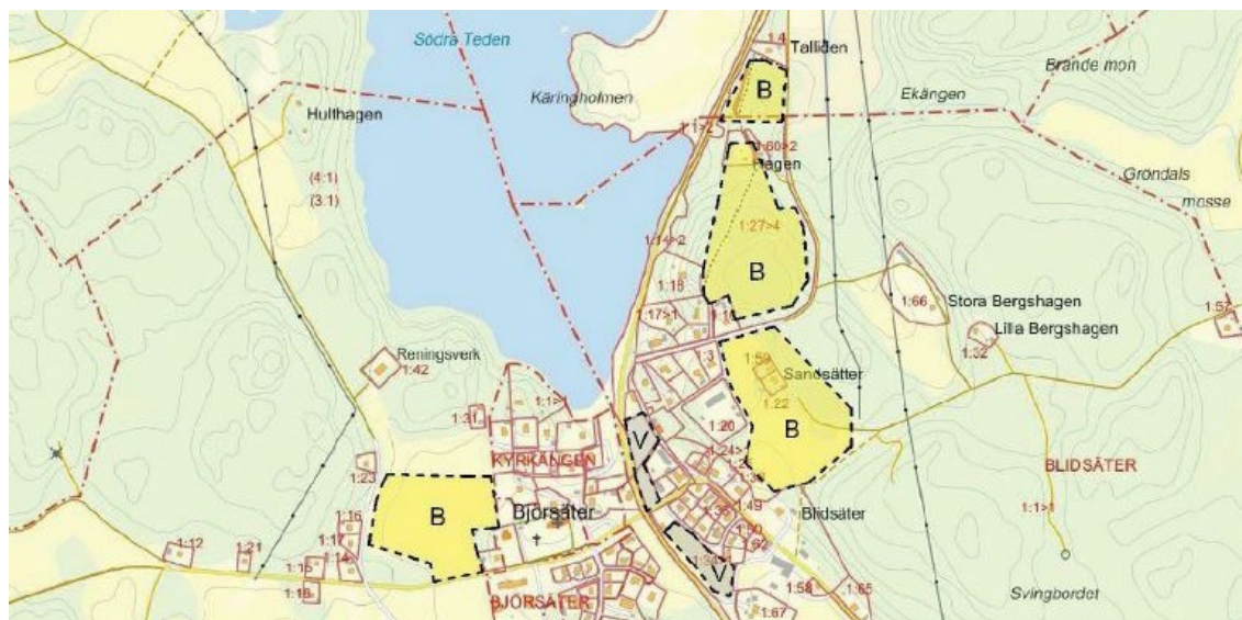
Utdrag ur Översiktsplanen

Aktuellt planområde är utpekad för bostäder i den kommunala översiktsplanen.