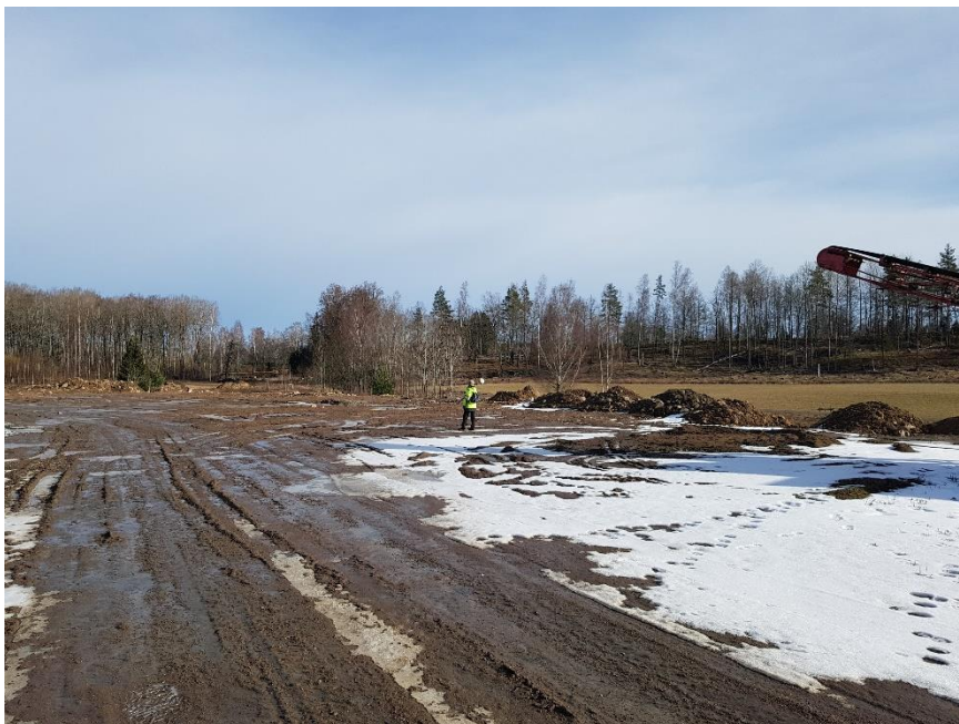
Centrala delen av utredningsområdet från sydväst.