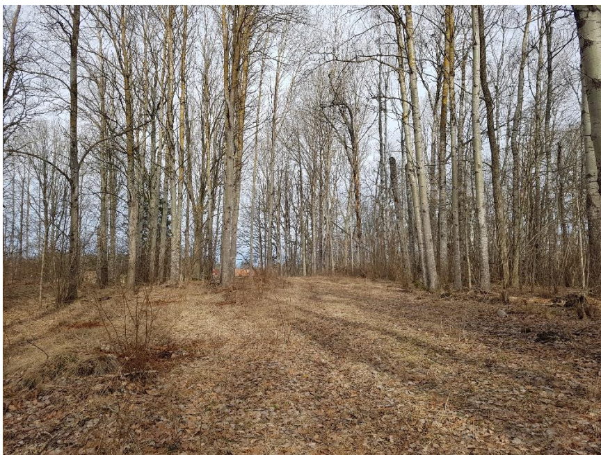
Kyrkängskullen från söder.