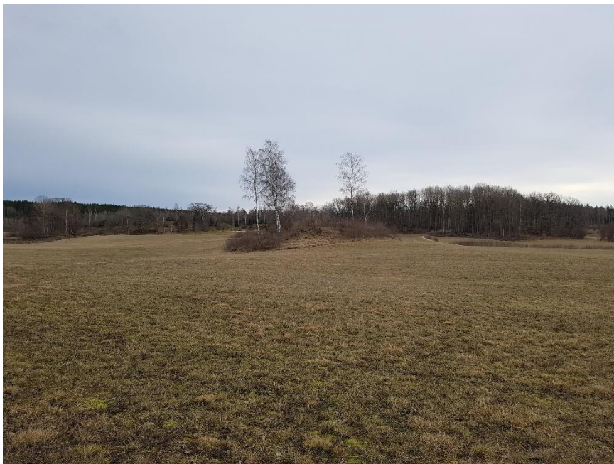
Objekt 1 från väster.