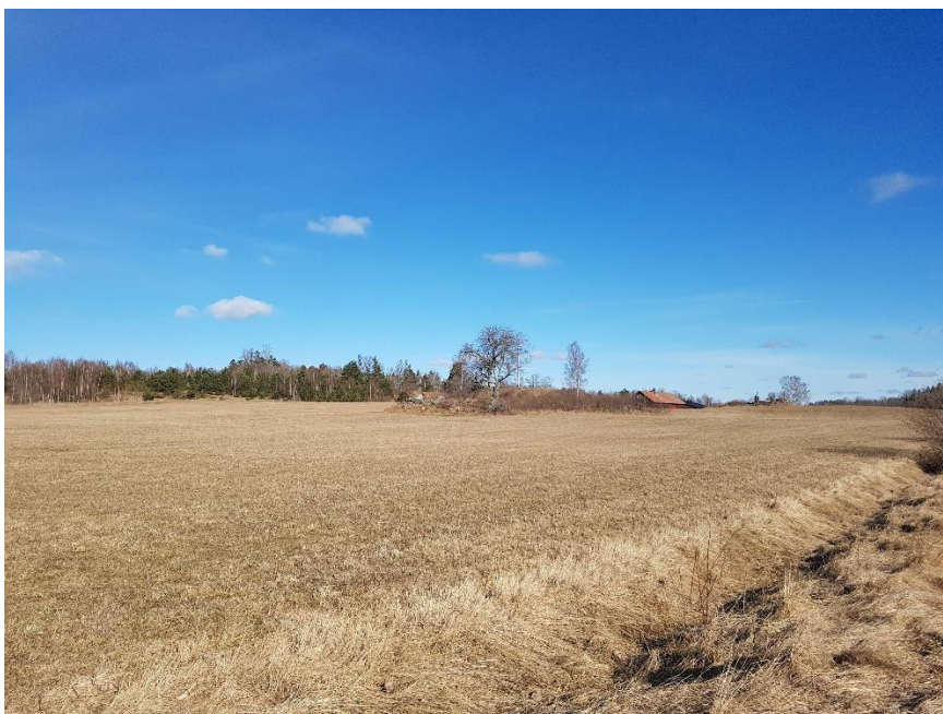
Objekt 1 från söder.