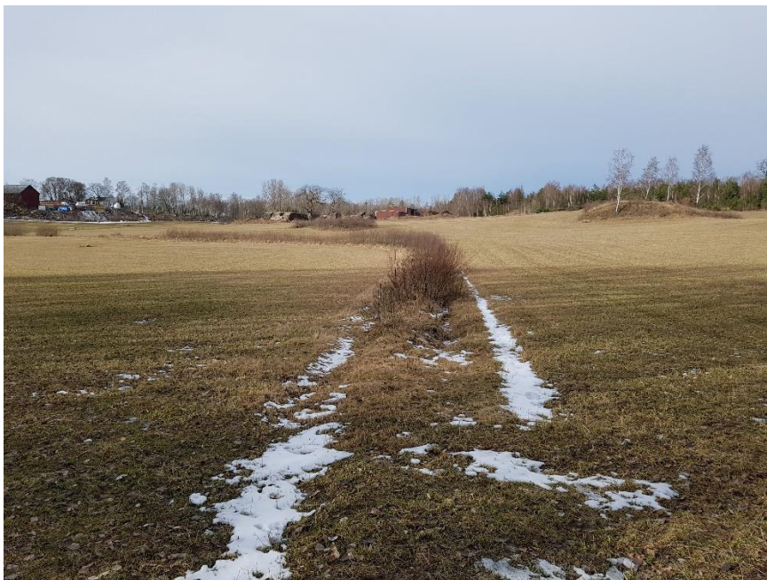
Vägen i norra delen av utredningsområdet från sydöst.