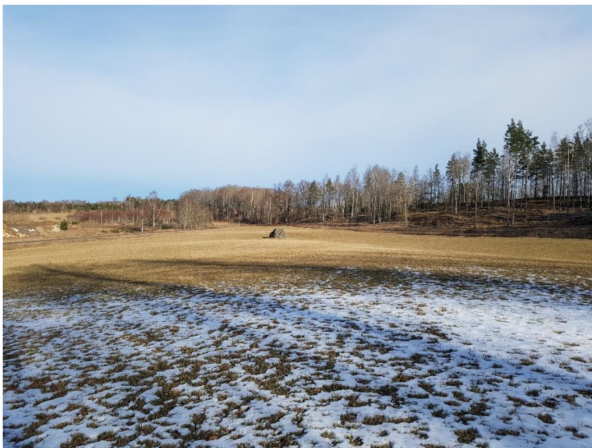
Objekt 2 från söder.